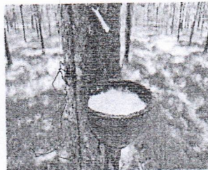
สวนยางพารา