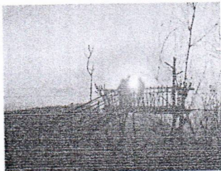
จุดชมวิวยางพาราทำข้าม

ปัจจุบัน องค์การบริหารส่วนตำบลควนหนองหงษ์ มีวิสัยทัศน์การพัฒนาท้องถิ่นคือ “เน้นนำบริการที่ดีมุ่งสู่สังคมแห่งคุณภาพ มีสาธารณูปการครบครัน และสิ่งแวดล้อมดี”