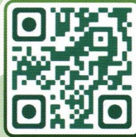
Happy Trails to Green Energy by ICD12