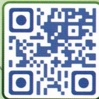
The World after the End by Powerpuff Girls