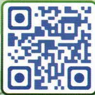
Eco-Horizon by DYWTYLM