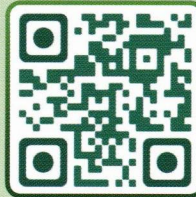
Heat Reverse by ICD11