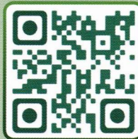
After the Change by Hutchew