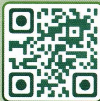
Salvation Earth by Level Up