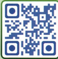
BCG Wonderland by ATH