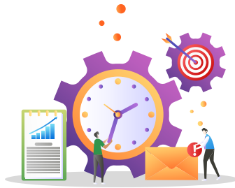
การประกาศช่องทางอิเล็กทรอนิกส์ฯ ตามมาตรา 10