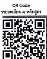
QR Code รายละเอียด ๗ หลักสูตร

รักษาการแทนผู้อำนวยการสำนักบริการวิชาการ