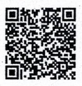
QR CODE แบบฟอร์ม ประวัติผู้สมัคร