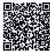
QR CODE แบบฟอร์มสมัคร