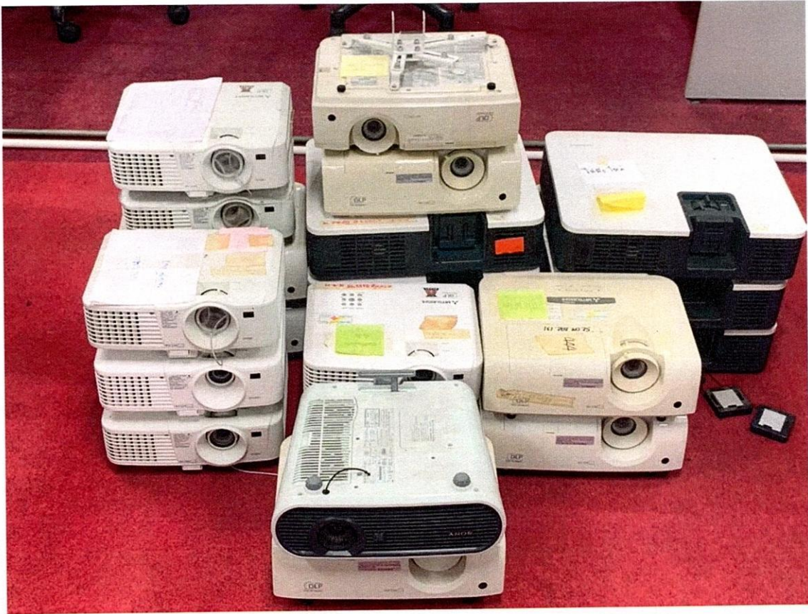
โปรเจคเตอร์