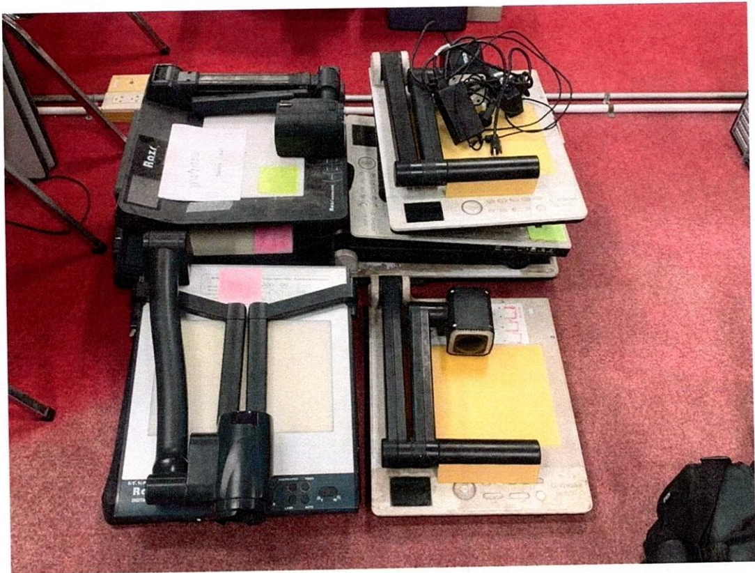
วิซวลไลเซอร์