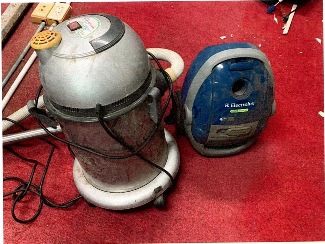
เครื่องดูดฝุ่น