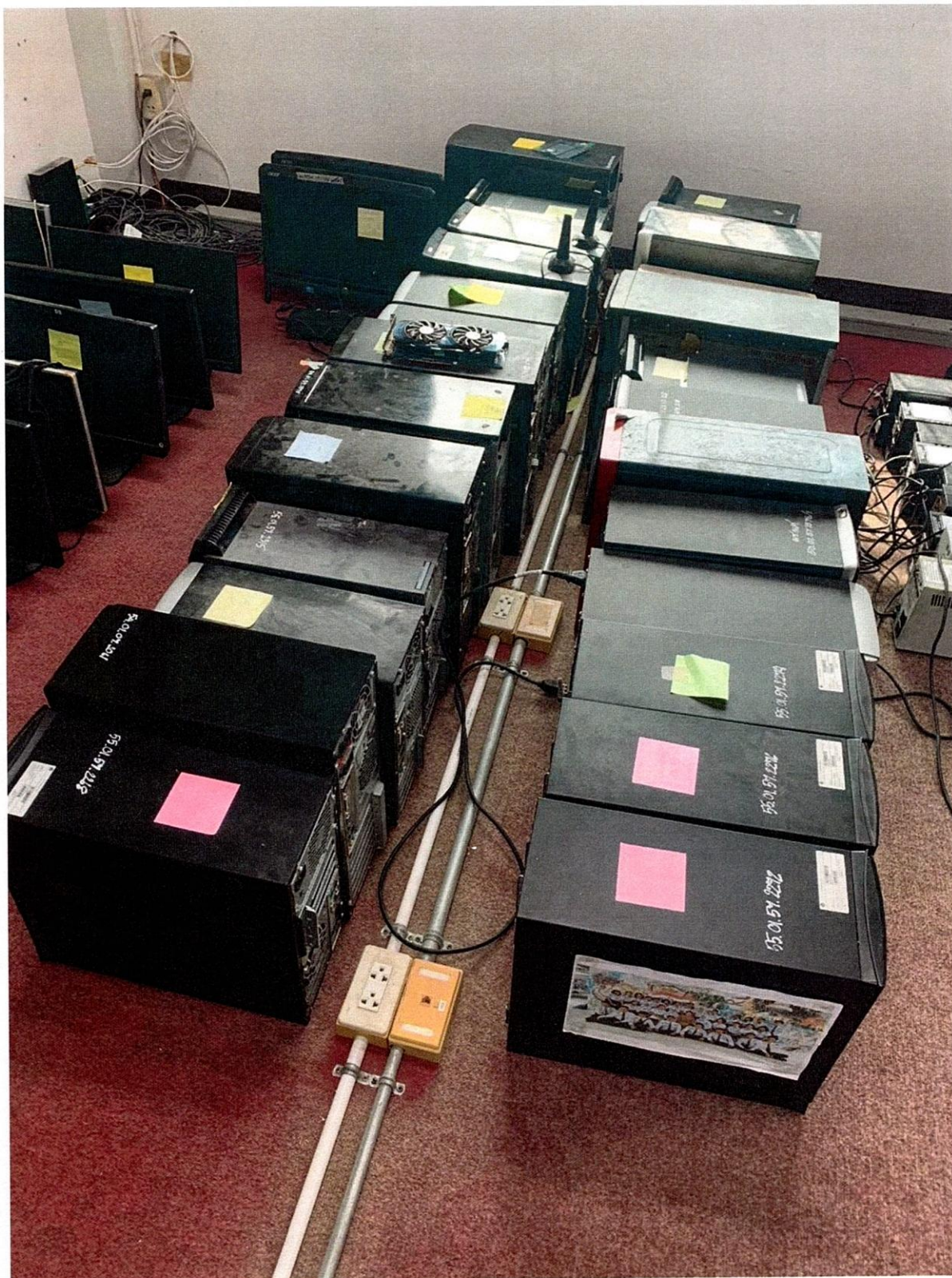
คอมพิวเตอร์