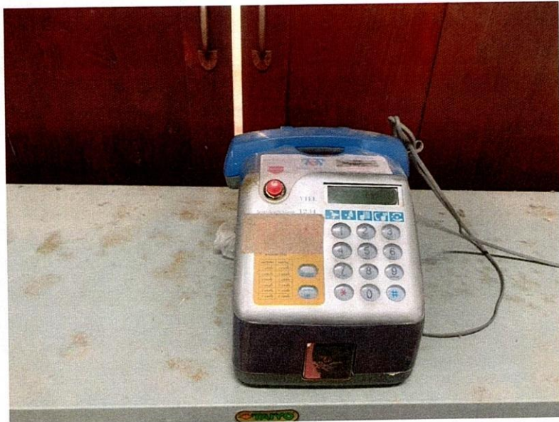
โทรศัพท์