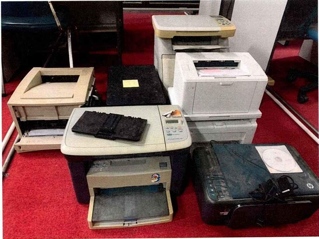
เครื่องพิมพ์