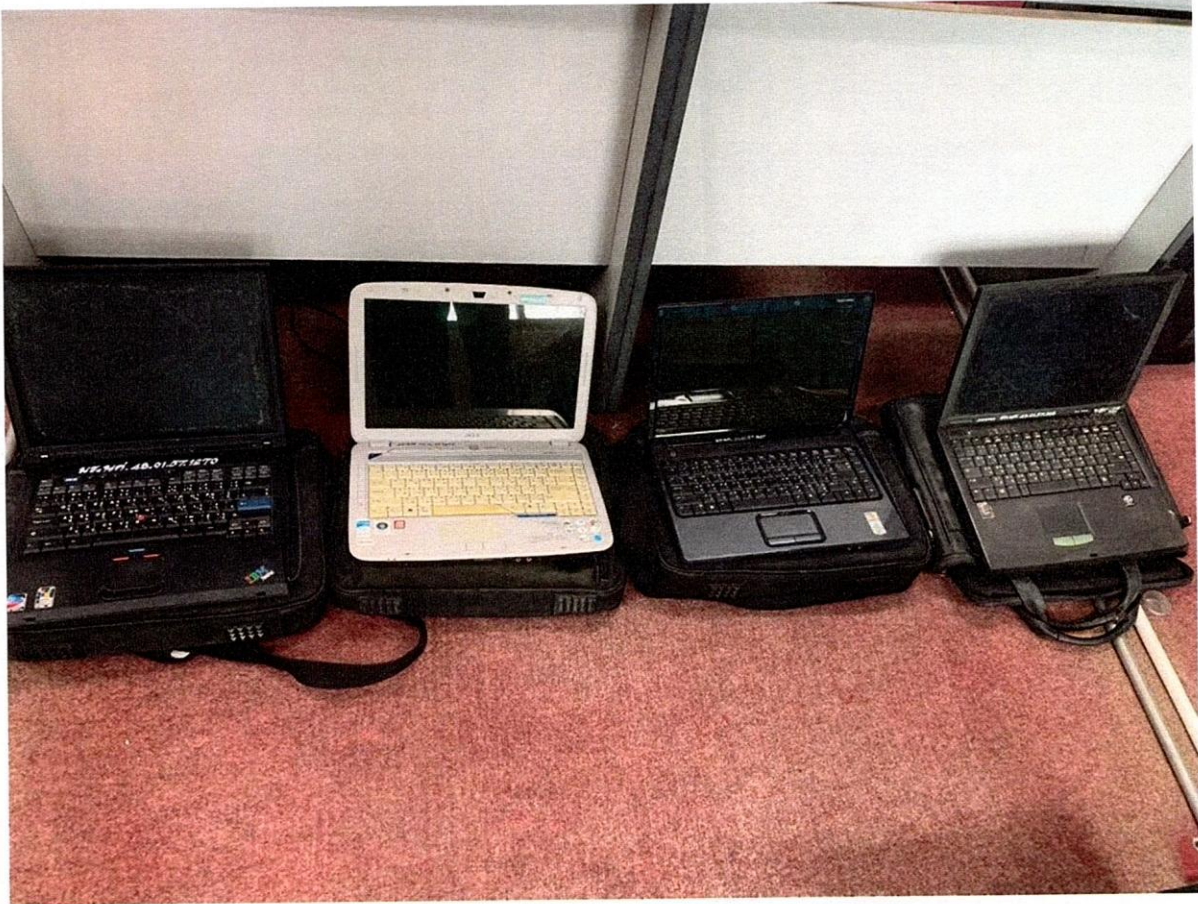
โน้ตบุ๊ก