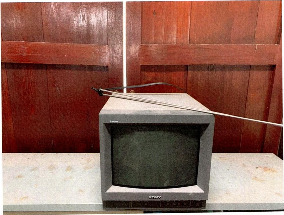
โทรทัศน์