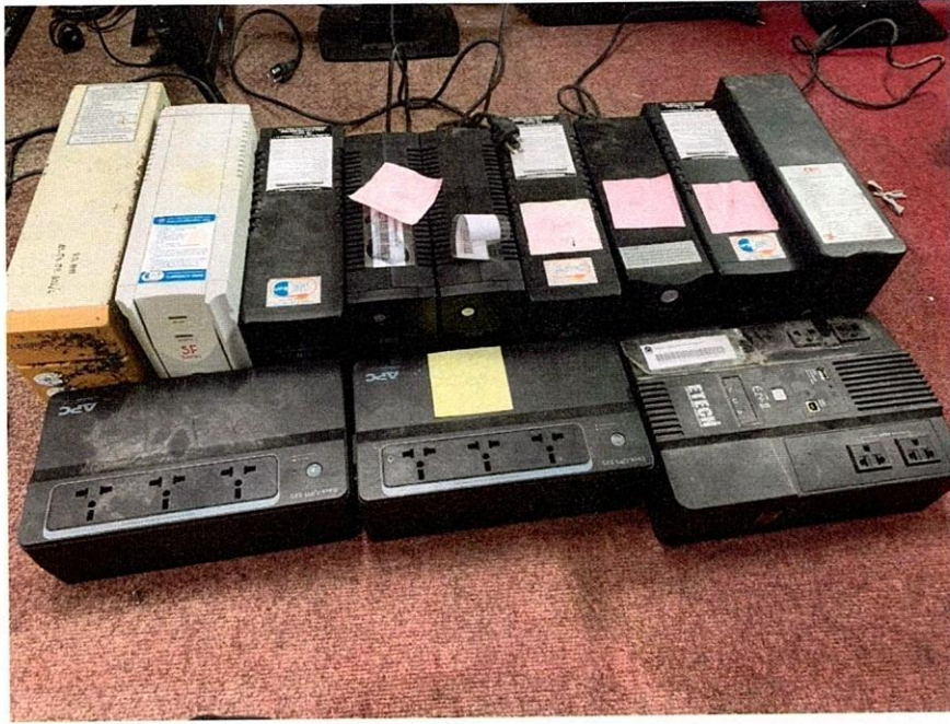
เครื่องสำรองไฟ