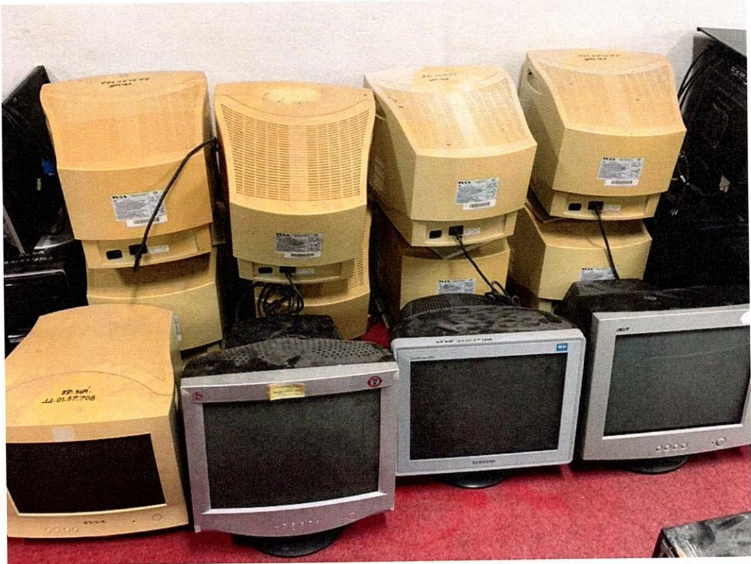
จอคอมพิวเตอร์