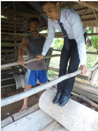
ภาพที่ 4 รีดกระจูด ด้วยลูกกลิ้ง