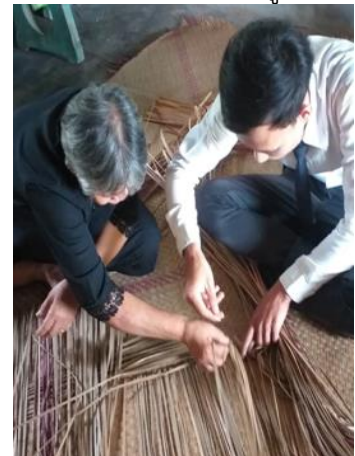
ภาพที่ 6 จักสานเสื่อกระจูด ลายดั้งเดิม (ลายสอง)