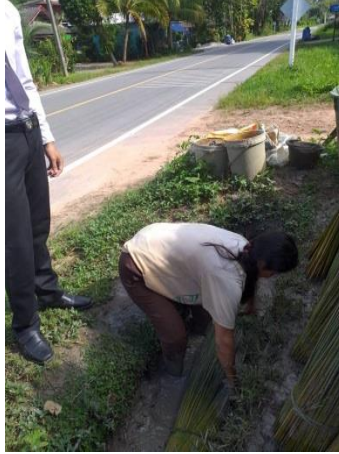
ภาพที่ 2 นำกระจูดไปคลุกโคลน