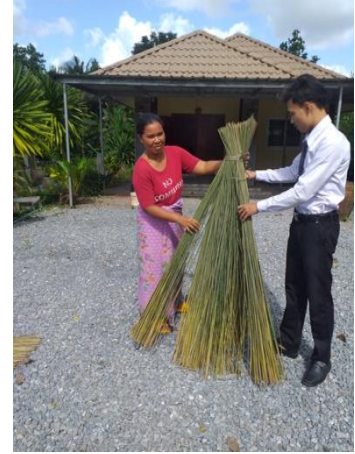
ภาพที่ 3 ตากกระจูด