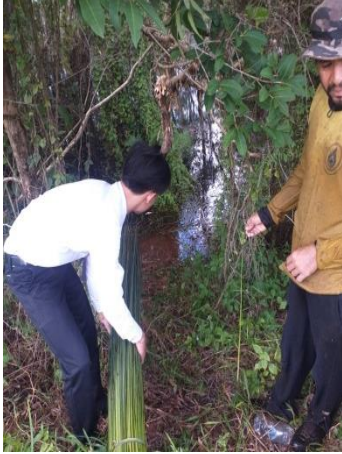
ภาพที่ 1 เตรียมกระจูด

จากผลการศึกษาวิธีการจักสานเสื่อกระจูดลายดั้งเดิม กรณีศึกษา: กลุ่มผลิตภัณฑ์กระจูด บ้านควนป้อม หมู่ที่ 1 ตำบล เคร็ง อำเภอลำดวน จังหวัดนครศรีธรรมราช ดังภาพที่ 1-8