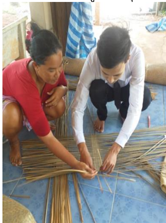
ภาพที่ 5 จักสานเสื่อกระจูด ลายดั้งเดิม (ลายซัด)