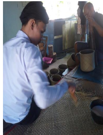
ภาพที่ 8 การเก็บริมเพื่อป้องกันไม่ให้ เส้นตอกกระจูดหลุดได้ง่าย