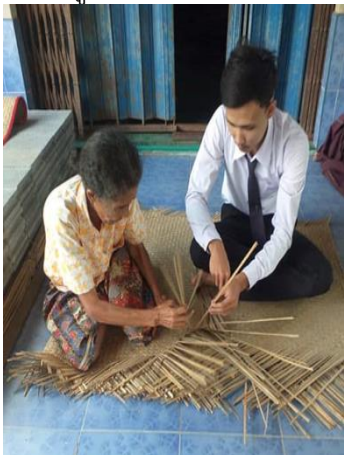
ภาพที่ 7 จักสานเสื่อกระจูดลายดั้งเดิม ลาย)สาม(