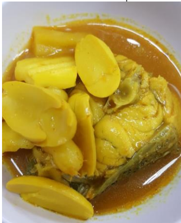
ภาพที่ 2 แกงส้มลูกประ

อีกหนึ่งเมนู คือ น้ำพริกลูกประ วิธีทำ นำลูกประสดแกะเปลือกออก หั่นเป็นแว่นบาง ๆ นำไปคั่วจนเหลืองกรอบ แล้วนำไปตำพอยุบ ๆ เติมหอมซอย กะปิ พริกขี้หนู ตำให้ละเอียด ปรุงรสด้วยนํ้าตาลปึกหรือนํ้าตาลทราย นํ้ามะนาวเล็กน้อย คลุกเคล้าให้เข้ากัน ชิมรสตามชอบ