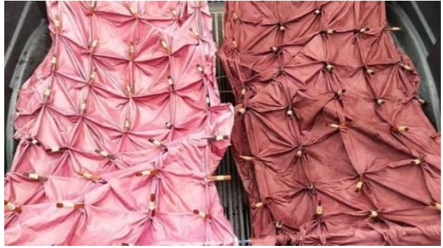
ภาพที่ 5 สีของผ้ามัดย้อมจากใบประ