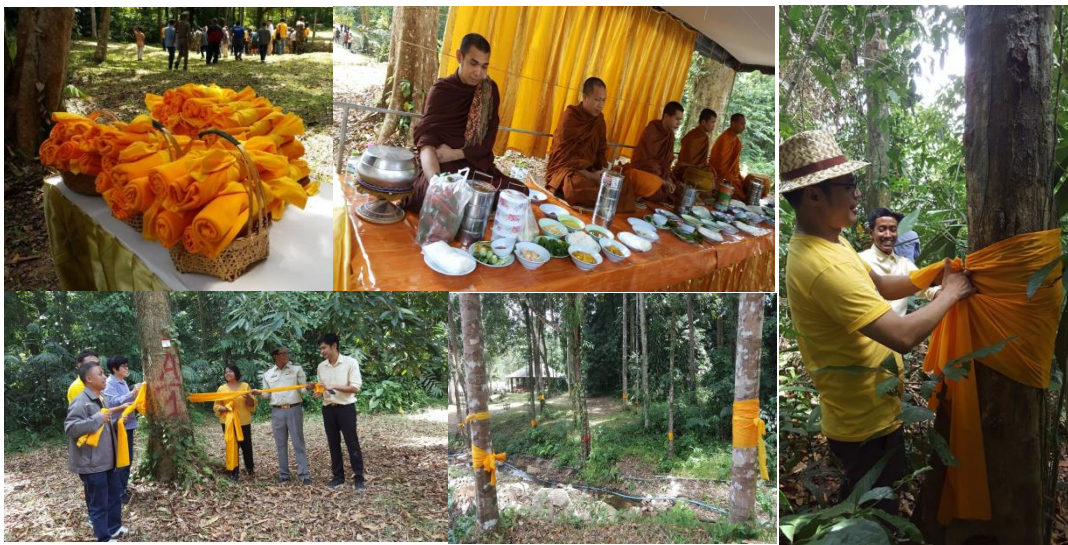
ภาพที่ 12 พิธีบวชป่าประ

นอกจากนี้ชาวบ้านในชุมชนนบพิตาจัดให้มีการบวชป่า ด้วยป่าประนบพิตาเป็นป่าประต้นน้ำ การอนุรักษ์ที่ชาวบ้านในชุมชนร่วมกันจัดทำคือการบวชป่า ซึ่งถือว่าเป็นการรักษาศีลไม่ตัดไม้ทำลายป่า โดยมีพระสงฆ์ให้ศีลให้พร ชาวบ้านจะนำผ้าสีเหลืองผูกไว้ตามต้นไม้ต่าง ๆ เป็นสิ่งบ่งบอกว่าบริเวณนี้จะมีการดูแลไม่มีการตัดต้นไม้ ซึ่งเป็นความตั้งใจที่จะอนุรักษ์และพลิกฟื้นผืนป่าประ โดยใช้ "พลังความศรัทธา" ภายใต้อิทธิพลตามหลักพุทธศาสนา มาประยุกต์ใช้ในการดูแลรักษาป่า ถือเป็นกุศโลบายในการต่ออายุป่าประและต้นไม้อื่น ๆ ภายใต้อุทยานแห่งชาติเขานันอีกทางหนึ่ง เพราะชาวบ้านในชุมชนเชื่อว่าหากนำจิ้วรามาหม่มและทำพิธีบวชป่าแล้ว ชาวบ้านในชุมชนจะไม่กล้าตัดหรือทำลายต้นไม้ในอุทยานแห่งชาติอีก สิ่งเหล่านี้ก่อให้เกิดความยั่งยืนในการดูแลรักษาผืนป่าและสามารถส่งต่อไปยังลูกหลานในอนาคต นอกจากนี้หลายครัวเรือนมีการนำเมล็ดประไปเพาะเพื่อปลูกริมแดนของหมู่บ้านและเป็นรั้วบ้านของตน ชาวบ้านในชุมชนนบพิตายินดีที่จะเข้าร่วมในโครงการขยายพันธุ์ต้นประร่วมกับอุทยานแห่งชาติเขานัน มีการวางระบบการดูแลรักษาและการจัดเก็บให้เป็นไปในทิศทางเดียวกัน เช่น ทาร็อกกับอุทยานแห่งชาติเขานันเจ้าของพื้นที่ ตลอดจนผู้นำชุมชนทุกฝ่ายเพื่อปกป้อง "ต้นประ" ที่มีอยู่มากมายให้เจริญเติบโตต่อไปและไม่ถูกตัดโค่นทำลาย ขณะเดียวกันก็ส่งเสริมการปลูกเพิ่มเติมในพื้นที่ต่าง ๆ ทั้งบริเวณที่ว่าง บนภูเขา และที่ราบตามบ้านเรือนของประชาชน