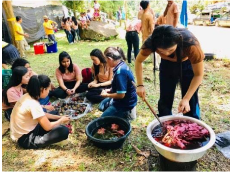
ภาพที่ 4 นักศึกษาใช้ใบประสดทำสีย้อมผ้า

นำมาทำสีย้อมผ้าได้โดยให้สีเป็นสีน้ำตาลอ่อน สีน้ำตาลเข้ม สีชมพูอมแดง และสีอิฐ แตกต่างไปตามระยะเวลาในการต้มและชนิดของผ้าที่ใช้ ทำให้ชาวบ้านสนใจเรียนรู้และมีแนวคิดในการต่อยอดที่จะทำผลิตภัณฑ์จากผ้ามัดย้อมจากใบประ