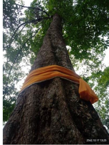
ภาพที่ 10 กริชในพิธีกรรมที่ขาดไม่ได้ ภาพที่ 11 ต้นประขั้ว