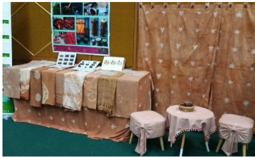
ภาพที่ 6 ผ้ามัดย้อมจากใบประ