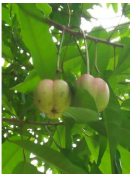
ภาพที่ 1 ผลประ

ภูมิปัญญาเเวศท้องถิ่นของการใช้ประโยชน์จากป่าประนบพิตำ ในวิถีของการใช้ประโยชน์ วิถีของวัฒนธรรมและวิถีของการอนุรักษ์ ในพื้นทีป่าประนบพิตำ อำเภอนบพิตำ จังหวัดนครศรีธรรมราช พบว่า ส่วนของประทีนำไปใช้ประโยชน์ คือเมล็ด ส่วนอื่น ๆ ไม่ว่าจะเป็นราก ลำต้น (เนื้อไม้) ใบ ดอก ผล หรือเปลือก ลำต้น ไม่ได้นำมาใช้ประโยชน์ ส่วนของเมล็ดนำไปใช้ประโยชน์ในการทำอาหาร วิธีการที่ใช้ในการเก็บเกี่ยว ผลผลิตจะเก็บบริเวณพื้นดิน ไม่ใช่วิธีการตัดกิ่ง ปีนขึ้นไปเก็บ หรือสอย เพราะลูกประจะแตกออกและหล่นลงมาเอง ประจะให้ผลผลิตต้นละประมาณ 50 กิโลกรัม ช่วงเวลาที่เก็บเมล็ดประจะเก็บได้ประมาณ 3 เดือน คือระหว่างเดือนสิงหาคมถึงเดือนตุลาคม จำนวนต้นประทีสามารถเก็บผลผลิตมาใช้มีจำนวนมากกว่า 100 ต้น ลักษณะพื้นที่และตำแหน่งบริเวณของประทีเก็บผล ชาวบ้านในชุมชนนบพิตำเรียกว่าหลังป่า ซึ่งหมายถึงเขตพื้นที่ของอุทยานแห่งชาติเขานัน รูปแบบการเข้าไปเก็บหาลูกประส่วนใหญ่จะไปเป็นคู่ หรือเป็นกลุ่มครอบครัว เครือญาติ หรือกลุ่มเพื่อน เริ่มเข้าไปเก็บตั้งแต่ 7 นาฬิกาและกลับออกมาประมาณ 14 นาฬิกา ในแต่ละวันลูกประจะแตกช่วงทีแสงแดดออกประมาณ 9 นาฬิกา จนถึงประมาณ 15 นาฬิกา และจะแตกน้อยลง ชาวบ้านในชุมชนรอบ ๆ อุทยานแห่งชาติเขานัน มีการพึ่งพิงและใช้ประโยชน์ในป่าประ ทั้งการเก็บหาของป่า พืช ผักป่า ต่าง ๆ ได้แก่ สะตอ เนียง เหยียง นาง ผักหวาน หน่อไม้ หวาย ดอกไม้ น้ำผึ้ง และลูกประ โดยเฉพาะลูกประนั้น ถือว่าเป็นแหล่งทีใหญ่ทีสุดของประเทศ ชาวบ้านทุกหลังคาเรือนพึ่งพิงเก็บหาของป่าทั้งเพื่อเก็บไว้บริโภคและขายเป็นรายได้เสริม โดยเฉพาะลูกประนั้นมีการเก็บเพื่อการบริโภคทุกหลังคาเรือน