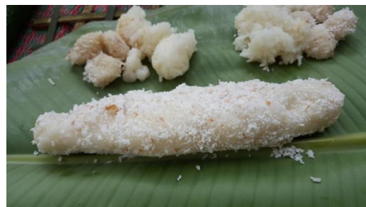
ภาพที่ 9 ไก่ขาวไส้หวาน เครื่องบูชาเทวดา