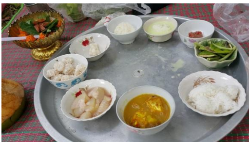
ภาพที่ 8 อาหารเครื่องบูชาครู