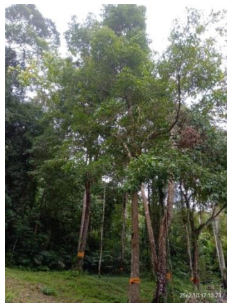
ภาพที่ 11 ป่าประ

การที่ป่าประมีประโยชน์โดยตรงและโดยอ้อมเช่นนี้ ชุมชนจึงร่วมกันอนุรักษ์ป่าประ พื้นที่ป่าเขานันได้รับการปกป้องดูแลจากชุมชน องค์กรชุมชนมาตั้งแต่บรรพบุรุษ นายประวัต ฐูวรรรัตน์ ผู้ใหญ่บ้านหมู่ที่ 8 บ้านทับน้ำเต้า เล่าว่า พื้นที่ป่าเขานันเคยเป็นพื้นที่ฐานปฏิบัติการของพรรคคอมมิวนิสต์แห่งประเทศไทย ทำให้พื้นที่นี้ได้รับการดูแลและปกป้องมายาวนาน โดยมีข้อตกลงภายในชุมชนในการจัดการทรัพยากรในท้องถิ่น