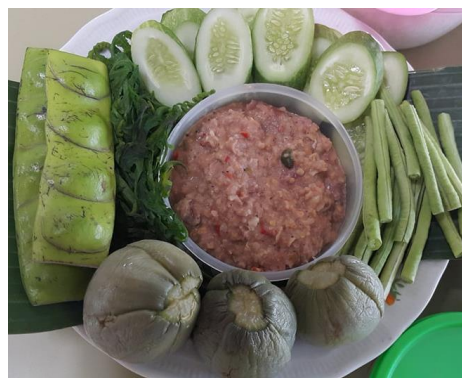
ภาพที่ 3 น้ำพริกลูกประ