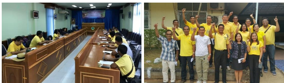
ภาพที่ 13 การจัดประชุมเพื่อจัดทำข้อตกลงการใช้ประโยชน์ของป่าประ