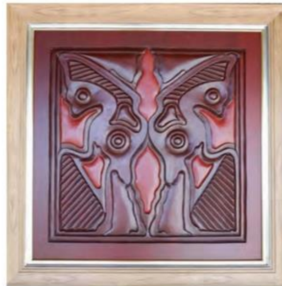
ชื่อผลงาน ยากที่สุดที่จะรู้ใจคน ขนาด 95 X 95 เซนติเมตร เทคนิค ไม้สักแกะสลักบุบดำ ปี 2562