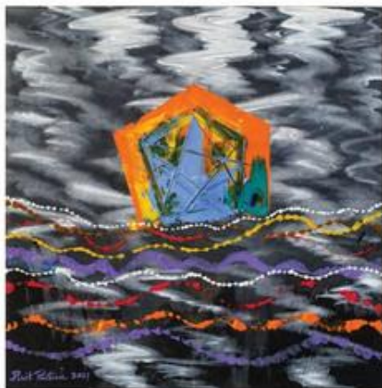
ชื่อผลงาน สายน้ำเมือง ขนาด 50x50 เซนติเมตร เทคนิค สีอะครีลิกบนผ้าใบ ปีที่สร้าง 2564