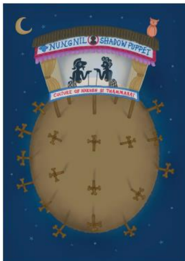
ชื่อผลงาน Ghost playing shadow play ขนาด 15x21 เซนติเมตร เทคนิค Painting by Procreate Application on IPAD Pro ปีที่สร้าง 2563