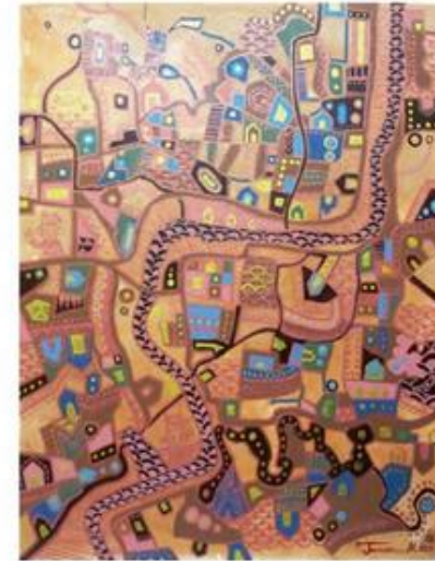
ชื่อผลงาน My home town 3 ขนาด 50x40 เซนติเมตร เทคนิค สีอะครีลิคบนผ้าใบ, Acrylic on canvas ปีที่สร้าง 2562