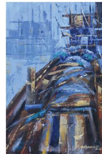
ชื่อผลงาน สับสลาย ขนาด 40x60 เซนติเมตร เทคนิค สีอะครีลิก ปีที่สร้าง -