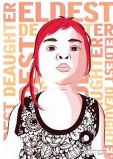
ชื่อผลงาน ย้าวหอมมะลิ ขนาด 30x40 เซนติเมตร เทคนิค Computer Graphic ปีที่สร้าง 2563