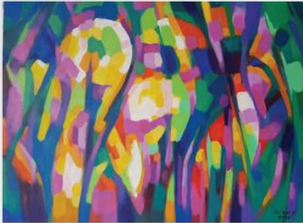
ชื่อผลงาน คำทวนและคำตอ ขนาด 80 X 100 เซนติเมตร เทคนิค สีอะครีลิค ปี 2561