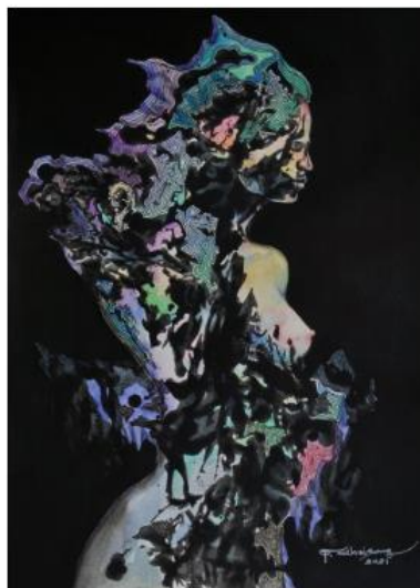
ชื่อผลงาน Nudity in the subconscious ขนาด 37x28 เซนติเมตร เทคนิค สีอะครีลิก สีน้ำ และปากกานบนกระดาษ ปีที่สร้าง 2564