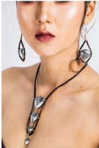
ชื่อผลงาน กม ไทย เก๋ ขนาด 30x40 เซนติเมตร เทคนิค การถนอมเงินบนเครื่องประดับ ปีที่สร้าง -