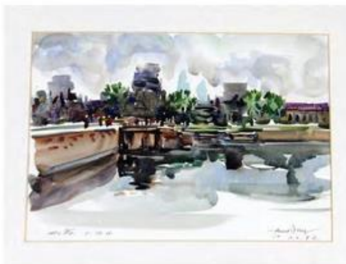
ชื่อผลงาน บรวิต 11.12 น. (Angkor Wat 11.12 pm) ขนาด 50x40 เซนติเมตร เทคนิค สีน้ำมันบนกระดาษ ปีที่สร้าง 2552