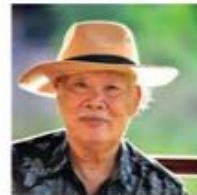
อินสนธิ วงศ์สาม Inson Wongsam ศิลปินแห่งชาติ สาขาศิลปะ (ประติมากรรม) ปี 2542