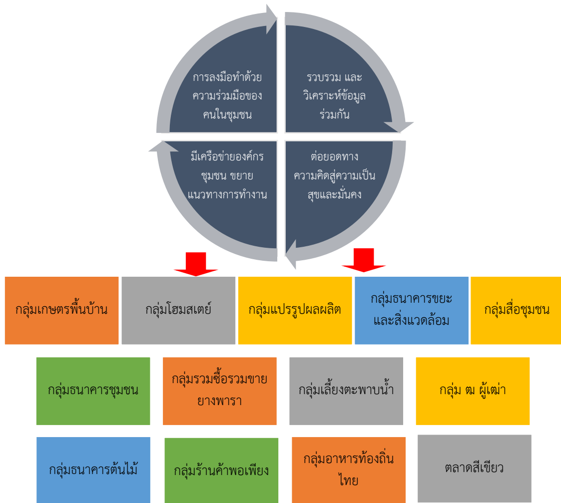
แผนภูมิที่ 2 องค์กรความรู้แนวคิดสู่การปฏิบัติของเศรษฐกิจพอเพียงเชิงบูรณาการ

3.13 วิถีไม้สามอย่างประโยชน์สี่อย่าง: กลุ่มธนาคารต้นไม้ ด้วยหลักปรัชญาเศรษฐกิจพอเพียง ทำให้ “ธนาคารต้นไม้” ถือกำเนิดขึ้นบนแนวคิดที่ว่า “ต้นไม้มีค่าเหมือนเงิน” เพราะการมีที่ดินและสามารถปลูกต้นไม้ได้โดยที่ตนเองไม่ต้องลงทุนอะไรเพิ่มเติม โดยเสนอโครงการฯ พิจารณาขึ้นทะเบียนรับรองต้นไม้เป็นสินทรัพย์ และสามารถนำมาใช้หนี้ได้ตามกฎหมาย เกิดแนวคิด “ขอแลกต้นไม้ที่ปลูกเป็นเงิน” เพราะต้นไม้สามารถนำไปใช้ประโยชน์ได้มากมายจากแนวคิดสู่การปฏิบัติของเศรษฐกิจพอเพียงเชิงบูรณาการ กรณีศึกษา มหาวิทยาลัยบ้านนอก ตำบลเนินซ้อ อำเภอกาหลง จังหวัดระยอง สามารถสรุปได้ ดังแผนภูมิที่ 2