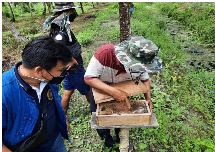
ภาพที่ 3 การเรียนรู้และนำไปปฏิบัติจริง เช่น การเลี้ยงผึ้งและชันโรง

4. มีการรวบรวมองค์ความรู้ด้านการจัดการชุมชนที่สามารถปฏิบัติได้จริงเพื่อเป็นแหล่ง ข้อมูล ข่าวสาร ความรู้ สารสนเทศ กิจกรรมและประสบการณ์ต่าง ๆ ในชุมชนที่สนับสนุนและส่งเสริมให้สามารถ หาความรู้และเรียนรู้ด้วยตนเองได้ตามอัธยาศัย (ณรงค์ ปัดแก้ว, 2564 : 79-92) ตัวอย่างในพื้นที่เทศบาลเมือง ปากพนุนจังหวัดนครศรีธรรมราช เกี่ยวกับการเรียนรู้และนำไปปฏิบัติจริง ได้แก่ การเลี้ยงผึ้งและชันโรงในสวน มะพร้าว ทำให้สามารถนำผลผลิตจากผึ้งและชันโรงไปจำหน่ายเป็นอาชีพเสริมเพิ่มรายได้ ดังภาพที่ 3