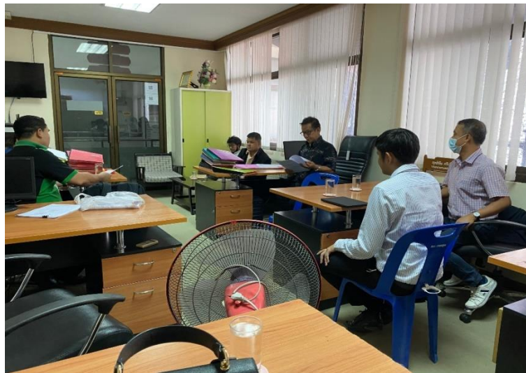
ภาพที่ 1 ร่วมค้นปัญหาร่วมกับหน่วยงานภาคีเครือข่ายในชุมชน

สามารถสรุปองค์ความรู้ได้ และมีความสามารถในการแก้ปัญหาในชีวิตประจำวันได้ (อิทธิพัทธ์ ศุภรัตน์วงศ์, 2559 : 1734-1749) เช่น การร่วมค้นปัญหาร่วมกับหน่วยงานภาคีเครือข่ายในพื้นที่เทศบาลเมืองปากพูน จังหวัดนครศรีธรรมราช เพื่อการสืบค้นปัญหา แลกเปลี่ยนความรู้และแก้ไขปัญหาลักษณะของการทำวิจัยร่วมกันทุกภาคส่วน ได้แก่ เทศบาลเมืองปากพูน ประชาชนในชุมชนปากพูน มหาวิทยาลัยราชภัฏนครศรีธรรมราชและภาคส่วนอื่น ๆ ที่เกี่ยวข้อง ดังภาพที่ 1