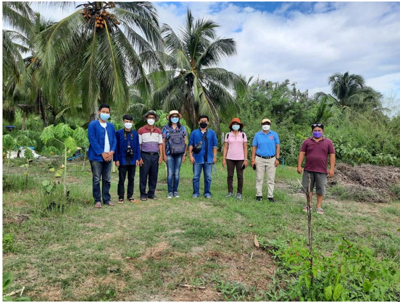
ภาพที่ 4 การสร้างเครือข่ายการเรียนรู้และสร้างความร่วมมือหรือดำเนินการในพื้นที่จริง