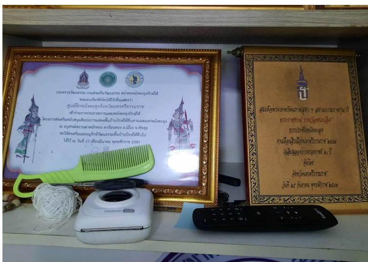
ภาพที่ 1 ตัวอย่างเกียรติบัตรศูนย์ฝึกหนังตะลุงจังหวัดนครศรีธรรมราช

การเชิดรูปเล่นเงา การพัฒนาด้านบทหนังตะลุง/บทกลอน/สาระการแสดง การพัฒนาด้านเครื่องดนตรี/เครื่องเสียง การพัฒนาด้านราคาหนังตะลุง การพัฒนาด้านผู้ชม การพัฒนาด้านเศรษฐกิจที่เกี่ยวกับการแสดงหนังตะลุง การพัฒนาด้านเทคโนโลยีที่ส่งผลกระทบต่อการคงอยู่ของหนังตะลุง รวมถึงการพัฒนาเกี่ยวกับการฝึกหัดเล่นหนังตะลุงของนายหนังตะลุงในยุคปัจจุบัน (สุรินทร์ ทองทศ, 2559 : 23-32) เช่น ตัวอย่างเกียรติบัตรศูนย์ฝึกหนังตะลุงจังหวัดนครศรีธรรมราช