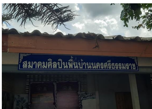
ภาพที่ 3 ตัวอย่างสมาคมศิลปปินพื้นบ้านนครศรีธรรมราช

ความเชื่อและการจัดการความรู้ในการแสดงคณะหนังตะลุงจำเป็นในด้านการแสวงหาความรู้ และการจัดเก็บความรู้เป็นขั้นตอนเพื่อสร้างคุณค่าของหนังตะลุง โดนการพัฒนาบุคคล และการพัฒนาชุมชน สังคมเพื่อการอนุรักษ์การแสดงหนังตะลุง และผู้ที่เกี่ยวข้อง ได้แก่ ผู้เป็นนายหนังตะลุง ลูกคู่หรือนักดนตรี ผู้รับหนังตะลุง ผู้ดูหรือผู้ชม และผู้ส่งเสริมหนังตะลุง (สุพัตรา คงขำ และนรินทร์ สังข์รักษา, 2558 : 242-255) ประกอบกับสถานการณ์ปัจจุบันที่การแสดงหนังตะลุงผ่านสื่อวิทยุกระจายเสียง วิทยุโทรทัศน์ ออนไลน์ และนำข้อมูลใหม่ ๆ มาสร้างเรื่องราวใหม่ ๆ ในการแสดงหนังตะลุงเป็นการเพิ่มอรรถรสในการชม มีการปรับตัวให้มีความร่วมสมัยมากขึ้น ทั้งเรื่องราวและดนตรี เป็นการสอดแทรกวัฒนธรรมและการสั่งสอนจากผู้ใหญ่สู่เด็กเยาวชนเพื่อการอนุรักษ์วัฒนธรรมท้องถิ่นไว้ได้ท่ามกลางกระแสเชี่ยวกรากของวัฒนธรรมตะวันตก (อรอนงค์ สวัสดิ์บุรี เดชมณี, 2557 : 65-82) ที่ชุบชีวิตสร้างจิตวิญญาณจนเป็นอัตลักษณ์ ปรัชญาชีวิตและคติธรรมคำสอนในทางพระพุทธศาสนาไว้ในลักษณะต่าง ๆ (พระครูโสภาสุตฺตมฺหาคุณ, พระครูโกศลอรธกิจ และอุทัย เอกสะพัง, 2563 : 146-157) เช่น ตัวอย่างสมาคมศิลปปินพื้นบ้านนครศรีธรรมราช