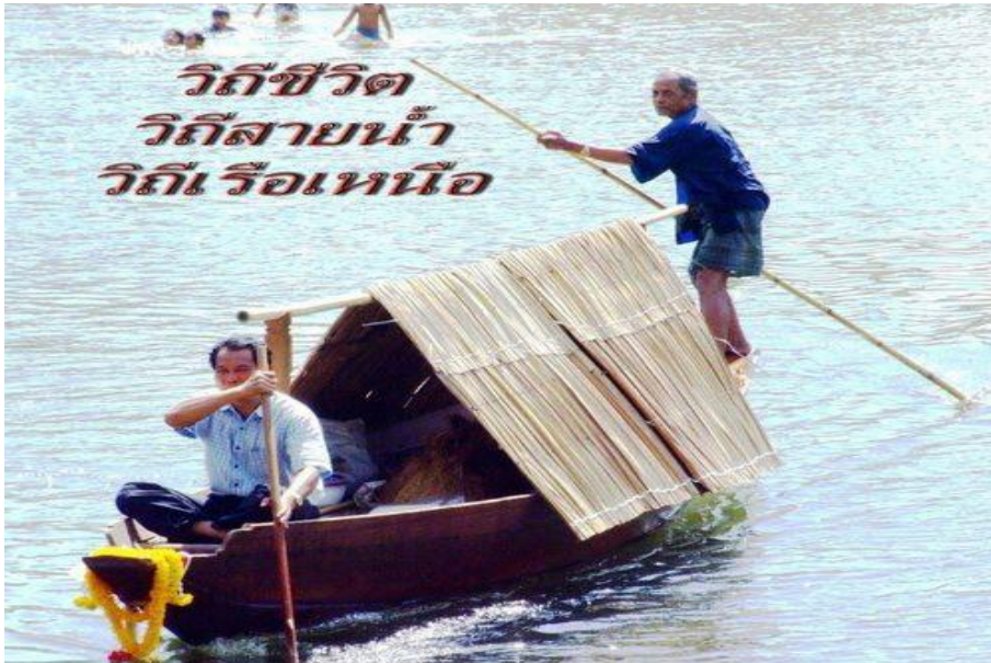
รูป 2 เรือเหนือคีรีวง

ต่างถิ่นเพื่อรับประทานกันในครอบครัว ก่อเกิดความสัมพันธ์ภายนอกชุมชน แม้ว่าคนในชุมชนคีรีวงส่วนใหญ่ไม่ชอบออกไปนอกชุมชนคีรีวง แต่ก็จะออกไปบ้างในยามจำเป็น เช่น ข้าวสารหมด เนื่องจากชุมชนคีรีวงมีพื้นที่เป็นภูเขาไม่สามารถปลูกข้าวได้ มีแต่สะตอ มังคุด ทุเรียนหมาก ฯลฯ จึงมีการแลกเปลี่ยนแลกเปลี่ยนข้าวสารกับภายนอกชุมชน โดยประมาณ 1-2 เดือนก็ออกไปนอกชุมชน หรือไปพบปะญาติพี่น้องในชุมชนอื่น ๆ รวมถึงไปหาหมอเมื่อยามไม่สบาย (Ratchabumpheng, S., 2015)