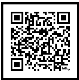
ลงทะเบียนอบรม

เพจ Facebook : IDT สถาบันเทคโนโลยีดิจิทัล PSRU