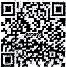
QR ลงทะเบียน

จึงเรียนมาเพื่อโปรดทราบ และโปรดพิจารณาให้ความอนุเคราะห์ประชาสัมพันธ์การประชุม ให้คณาจารย์ นักวิจัย นักวิชาการ นิสิตนักศึกษา ในสังกัดของท่านรับทราบโดยทั่วกันด้วย จะเป็นพระคุณยิ่ง