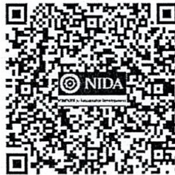
QR Code for International Papers Submission

- The minimum and maximum length of both an abstract is 150 - 250 words, that of a full paper no longer than 15-25 pages (excluding tables, appendices, and references) and keywords of 3-5 words.