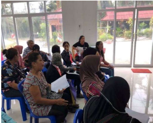
ภาพที่ 4 การเข้าร่วมแสดงความคิดเห็นร่วมกันของคนในชุมชนโดยไม่แบ่งแยกศาสนา