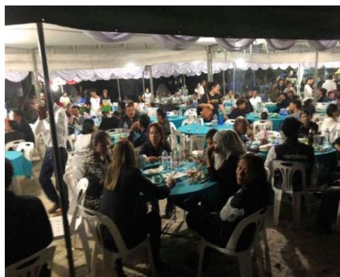
ภาพที่ 2 การเข้าร่วมงานในชุมชน โดยสามารถรับประทานอาหารร่วมกันได้