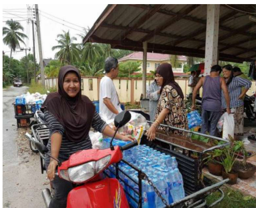
ภาพที่ 1 การมีน้ำใจเสียสละมอบของช่วยงานเอื้อเฟื้อกันของคนในชุมชน

2.2 ปัญหาด้านความเข้มข้นในการนับถือศาสนา พบว่า ปัจจุบันไม่ค่อยใส่ใจกับเรื่องศาสนา มากกว่าคนเมื่อก่อน โดยส่วนใหญ่ทุกคนให้ความสำคัญกับการนับถือพระเจ้าของแต่ละคน โดยมีการสืบทอดกันมาจนถึงในยุคปัจจุบัน และอนุรักษ์สิ่งที่บรรพบุรุษที่สืบทอดต่อกันมา อาจจะมีในเรื่องของประเพณีบางสิ่งบางอย่างที่หายไปบ้างเล็กน้อย ซึ่งเป็นเรื่องใหญ่พุทธศาสนิกชนต้องให้ความสำคัญ แต่ส่วนใหญ่เรามักจะมองในมุมมองที่แคบไม่เห็นปัญหาในภาพรวม ปัญหาต่าง ๆ จึงไปตกอยู่ที่วัด หรือพระสงฆ์ทั้ง ๆ ที่ปัญหาเหล่านั้น ทุกคนต้องมีส่วนร่วมในการรับผิดชอบ