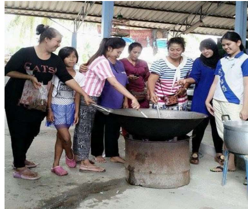
ภาพที่ 5 การร่วมแปรรูปผลผลิตภายในชุมชนร่วมกันอย่างสันติสุขไทยพุทธ-มุสลิม