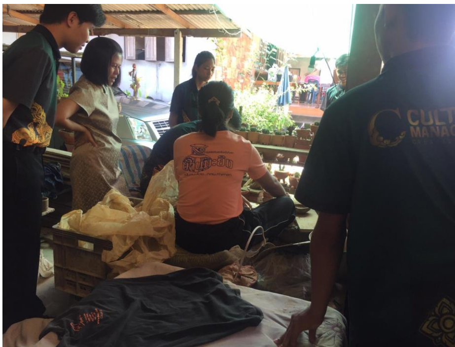
ภาพประกอบการบรรยาย เกี่ยวกับการฝึกปฏิบัติการทำเครื่องปั้นดินเผาโมคลาน กิจกรรมที่ 7 เรียนรู้ภูมิปัญญาและวัฒนธรรมท้องถิ่น