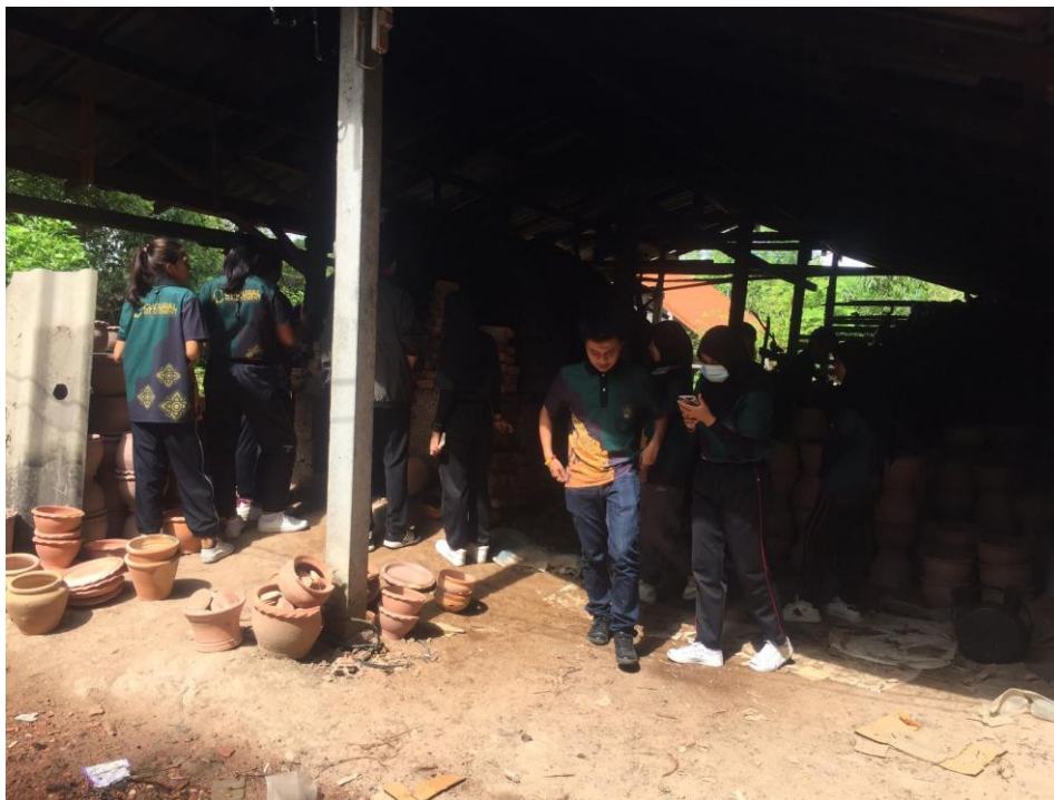
ภาพประกอบการบรรยาย

เกี่ยวกับการศึกษาอุปกรณ์การทำเครื่องปั้นดินเผาและเตาเผาเครื่องปั้นดินเผา กิจกรรมที่ 7 เรียนรู้ภูมิปัญญาและวัฒนธรรมท้องถิ่น