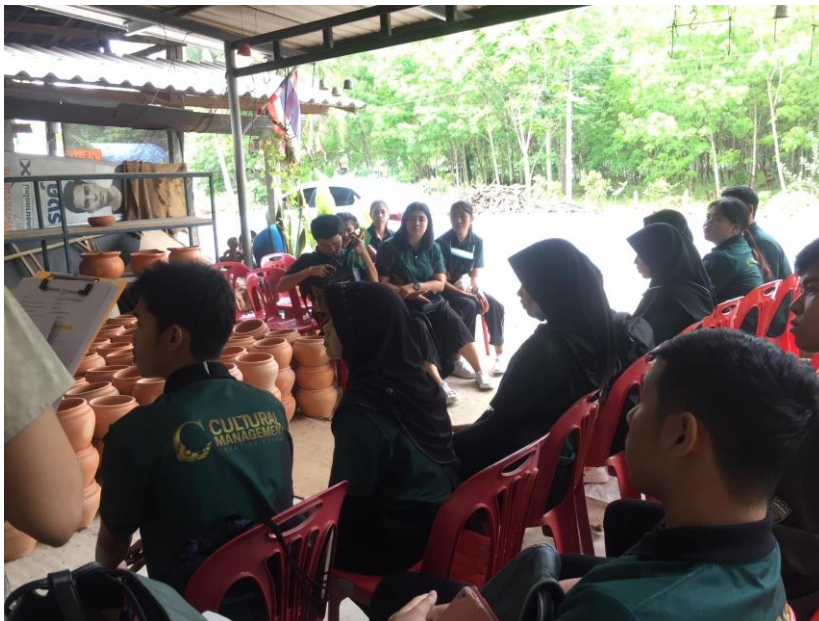
ภาพประกอบการบรรยาย เกี่ยวกับวัฒนธรรมและภูมิปัญญาการทำเครื่องปั้นดินเผาโมคลาน กิจกรรมที่ 7 เรียนรู้ภูมิปัญญาและวัฒนธรรมท้องถิ่น