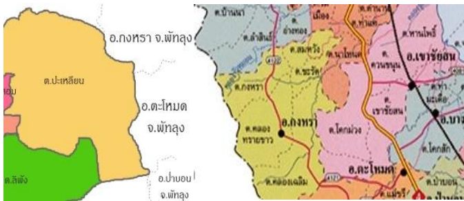
ภาพที่ 1 แผนที่รอยต่ออำเภอปะเหลียนกับอำเภอกงหรา

กล่าวถึงหมวดบุหร่งผู้มีฐานะมั่งคั่ง มีภรรยาชื่อมาหน้า ทำหน้าที่เป็นนายด่านที่ บ้านช่องนกร้า มีบุตรชายชื่อพลายทอง อายุย่างเข้า 20 ปี เห็นควรมีเหย้าเรือนจึงจัด ผู้ใหญ่ไปสู่ขอแหะเว เมื่อจันที่ทราบก็โกรธแค้นและตั้งใจจะไปฆ่าพลายทอง แต่นาง สีหะผู้เป็นมารดาห้ามไว้ เมื่อกล่าวถึงเจะหยังห้วนบิดาของเมืองสิตซึ่งเสียชีวิตไปแล้ว เกิดความรุ่มร้อนจึงแทรก กุโบร์ 6 ขึ้นมา ธิบเหาะจากป่าช้าตรงไปบ้านชะรัตเห็นเมืองสิตติด ชื่อคาถูกองจำ ด้วยความสงสารลูกจึงร้ายเวทมนตร์สะเดาะชื่อคาโช่ตรวน ปลุกให้เมืองสิต ตื่นขึ้นและหายตัวไป เมืองสิตจึงหนีไปยังไทรบุรี ฝ่ายหมวดบุหร่งครั้งนี้ถึงกำหนดวัน แต่งงานบุตรชายก็ยกขันหมากนำพลายทองไปแต่งงานกับแหะเวตามประเพณีของ ชาวไทยมุสลิม ครบสามวัน แล้วจึงรับแหะเวมาอยู่กินกับพลายทองที่บ้านช่องนกร้า อย่างมีความสุข ซึ่งแผนที่อำเภอปะเหลียน จังหวัดตรัง แสดงให้เห็นถึงรอยต่อเขตแดนกับ อำเภอกงหรา จังหวัดพัทลุงในปัจจุบัน แสดงให้เห็นดังภาพที่ 1