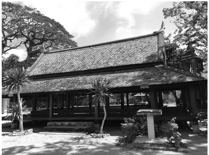
ศาลาการเปรียญอายุ 100 ปี วัดคูเต่า

ศักดิ์สิทธิ์ภายในวัดให้เป็นไปด้วยความเรียบร้อย แต่การบริหารจัดการและการอนุรักษ์โบราณสถานที่มีความสำคัญและมีคุณค่าทางประวัติศาสตร์ของชาตินั้น ต้องใช้ความรู้ความเข้าใจในการบริหารจัดการ ทั้งด้านการจัดสภาพแวดล้อม การดูแลรักษาความสะอาด และความเป็นระเบียบเรียบร้อยบริเวณโดยรอบ โบราณสถาน ซึ่งจากการวิจัยพบว่าคณะกรรมการบริหารวัดยังขาดความรู้ ความชำนาญด้านการอนุรักษ์โบราณสถานดังกล่าว อีกทั้งยังไม่ค่อยได้รับความร่วมมือจากองค์กรปกครองส่วนท้องถิ่นในพื้นที่และหน่วยงานภาครัฐที่มีอำนาจหน้าที่ตามกฎหมายเท่าที่ควร 15 ส่วนชุมชนและประชาชนโดยรอบวัดคูเต่า และวัดนารังนกนั้นพร้อมให้ความร่วมมือกับทางวัดในการส่งเสริม สนับสนุน การบริหารจัดการและการอนุรักษ์โบราณสถานดังกล่าว แต่องค์กรปกครอง ส่วนท้องถิ่นในพื้นที่ รวมถึงหน่วยงานภาครัฐที่เกี่ยวข้องกลับไม่เปิดโอกาสให้ ชุมชนและประชาชนบริเวณโดยรอบโบราณสถานเข้ามามีส่วนร่วมในการ บริหารจัดการร่วมกับหน่วยงานรัฐมากนัก 16