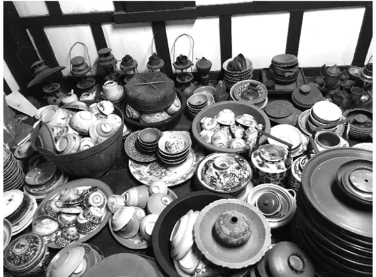
ซ้าย: สถาปัตยกรรมภายใน วัดคูเต่า ขวา: ศิลปวัตถุของวัด นารังนก

วัฒนธรรม จารีตประเพณี ภูมิปัญญาท้องถิ่นภายในเขตความรับผิดชอบของ องค์การบริหารส่วนตำบลนั้นก็ยังมีส่วนร่วมน้อยมากในการบริหารจัดการและ อนุรักษ์โบราณสถานชุมชนตำบลแม่ทอม