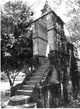
สะพานมอญอายุ 100 ปี

ศักดิ์สิทธิ์ภายในวัดให้เป็นไปด้วยความเรียบร้อย แต่การบริหารจัดการและการอนุรักษ์โบราณสถานที่มีความสำคัญและมีคุณค่าทางประวัติศาสตร์ของชาตินั้น ต้องใช้ความรู้ความเข้าใจในการบริหารจัดการ ทั้งด้านการจัดสภาพแวดล้อม การดูแลรักษาความสะอาด และความเป็นระเบียบเรียบร้อยบริเวณโดยรอบ โบราณสถาน ซึ่งจากการวิจัยพบว่าคณะกรรมการบริหารวัดยังขาดความรู้ ความชำนาญด้านการอนุรักษ์โบราณสถานดังกล่าว อีกทั้งยังไม่ค่อยได้รับความร่วมมือจากองค์กรปกครองส่วนท้องถิ่นในพื้นที่และหน่วยงานภาครัฐที่มีอำนาจหน้าที่ตามกฎหมายเท่าที่ควร 15 ส่วนชุมชนและประชาชนโดยรอบวัดคูเต่า และวัดนารังนกนั้นพร้อมให้ความร่วมมือกับทางวัดในการส่งเสริม สนับสนุน การบริหารจัดการและการอนุรักษ์โบราณสถานดังกล่าว แต่องค์กรปกครอง ส่วนท้องถิ่นในพื้นที่ รวมถึงหน่วยงานภาครัฐที่เกี่ยวข้องกลับไม่เปิดโอกาสให้ ชุมชนและประชาชนบริเวณโดยรอบโบราณสถานเข้ามามีส่วนร่วมในการ บริหารจัดการร่วมกับหน่วยงานรัฐมากนัก 16