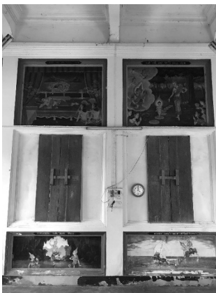
จิตรกรรมฝาผนัง พระอุโบสถวัดนารังนก