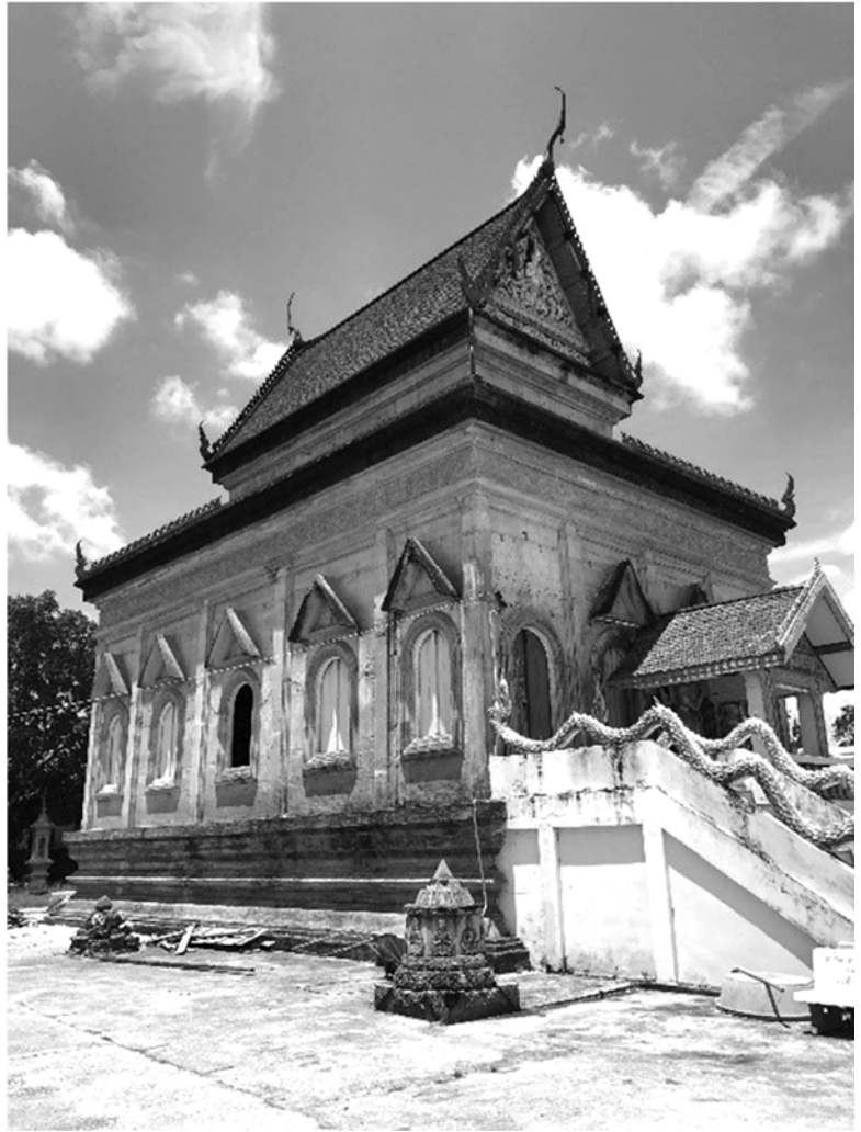
พระอุโบสถวัดนารังนก ตำบลแม่ทอม อำเภอ บางกล่ำ จังหวัดสงขลา

(UNESCO) 7 อีกทั้งพระอุโบสถของวัดนารังนกซึ่งมีอายุเก่าแก่เช่นเดียวกับวัดคูเต่า ซึ่งเชื่อกันว่าสร้างในรัชกาลพระเจ้าอยู่หัวบรมโกศ สมัยกรุงศรีอยุธยา โดยโบราณสถานทั้งสองแห่งดังกล่าวได้รับการขึ้นทะเบียนเป็นโบราณสถานตามกฎหมายจากกรมศิลปากร กระทรวงวัฒนธรรมแล้ว 8 ซึ่งการเป็นมรดกทางวัฒนธรรมของโบราณสถานของวัดคูเต่าและวัดนารังนกนั้นมีความสำคัญต่อชุมชนแม่ทอมเป็นอย่างมาก เนื่องจากมรดกทางวัฒนธรรมเฉพาะแหล่งประวัติศาสตร์โบราณคดี โบราณสถาน โบราณวัตถุ และศิลปวัตถุเป็นทรัพยากรที่ก่อให้เกิดประโยชน์ในการสร้างความมั่นคงด้านจิตใจ เสริมสร้างการเรียนรู้และความเข้าใจเกี่ยวกับภูมิปัญญาดั้งเดิม นอกจากนี้ยังสามารถสร้างความมั่นคงทางด้านเศรษฐกิจในระดับหนึ่งให้กับชุมชนท้องถิ่นได้ หากมีการจัดการ